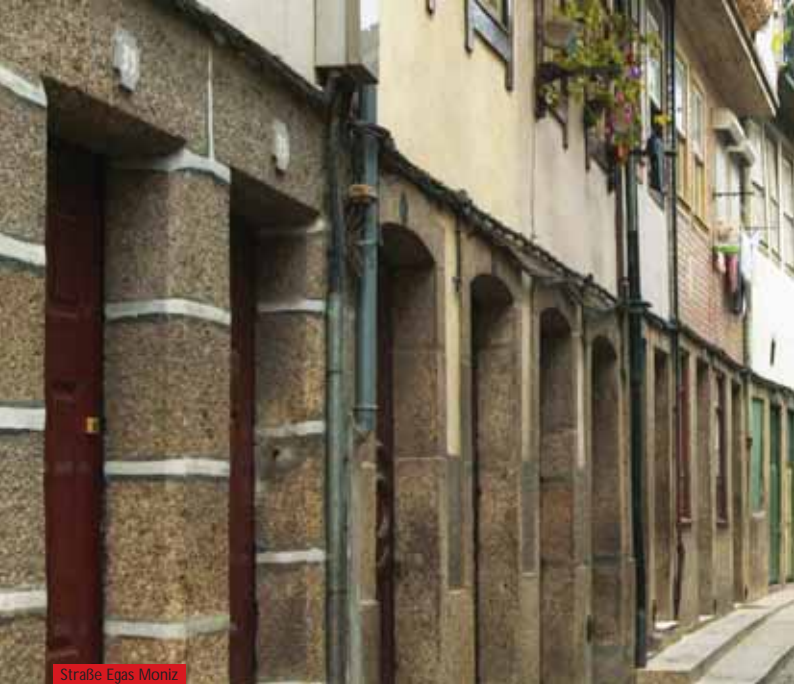
Straße Egas Moniz