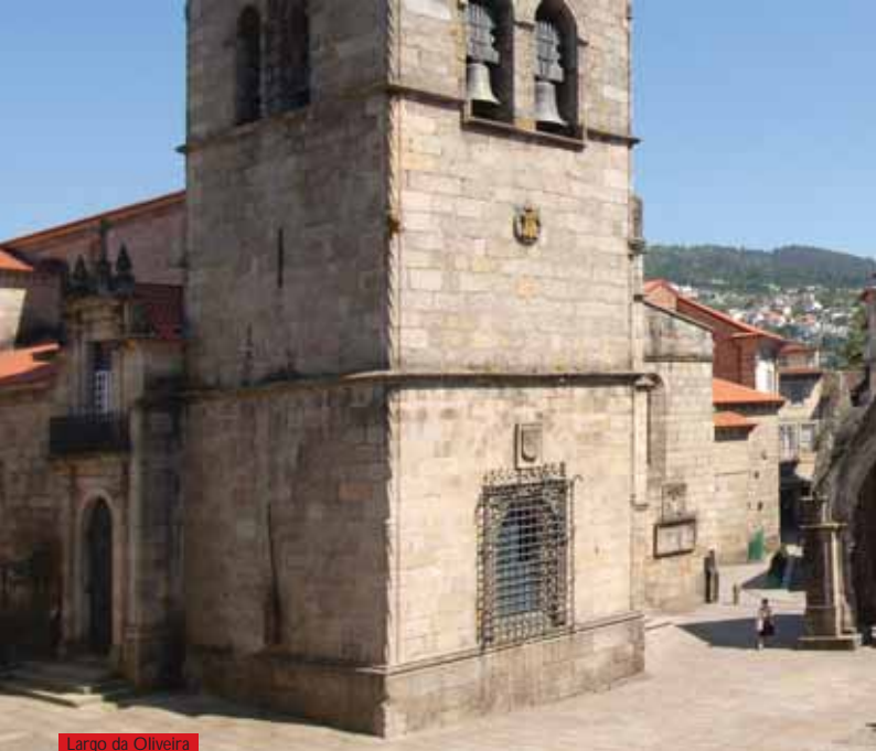
Largo da Oliveira