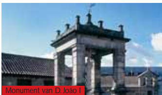
Monument van D. João I